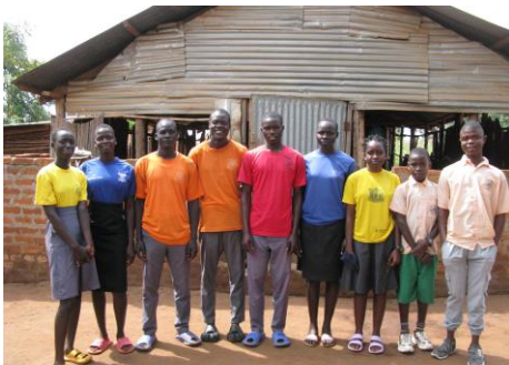
Kouluprojektin lapsia ja nuoria

Vähän väliä tietä pitkin marssivat valmistujaiskulkueet keskeyttävät arkiset toimet: lapset ja nuoret ovat pukeutuneet valmistujaisviittaan ja hattuun, kulkueita säestää torvien ja rumpujen soitto sekä iloinen huuto ja kiljunta. Tunnelma on varmaan monella tapaa samanlainen kuin ensimmäisen adventin evankeliumitekstissä, jossa Jeesus ratsastaa Jerusalemiin aasilla ja ihmiset huutavat hoosiannaa. Ilmassa on iloa ja riemua, eikä huomisen huolet sillä hetkellä vaivaa.